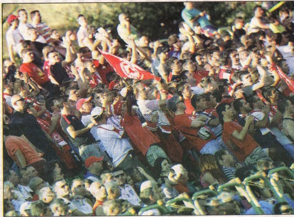
Великата публика на ЦСКА направи и от стадиона в Благоевград червена територия, но като че ли забравя заговора на ФК Калъфка и БФС...